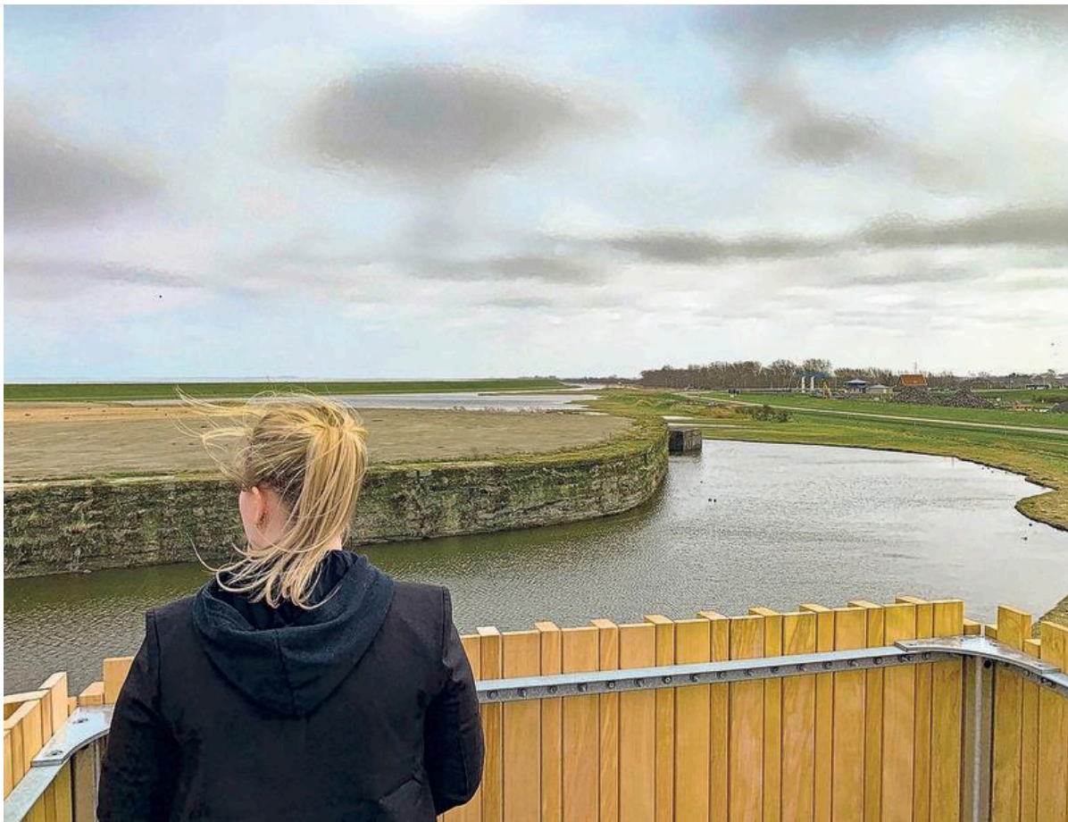
Bovenop de toren is er een ruim uitzicht over het gebied.