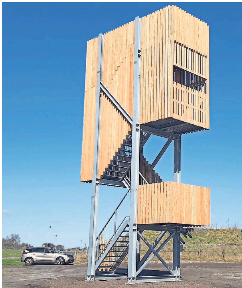
De uitkijktoren aan de rand van het Balgzand.

De andere beleefpunten van Landschap Noord-Holland zoals 't Kuitje, de fotovogelhut en het vogelkijkscherm zijn momenteel wel afgesloten voor publiek.