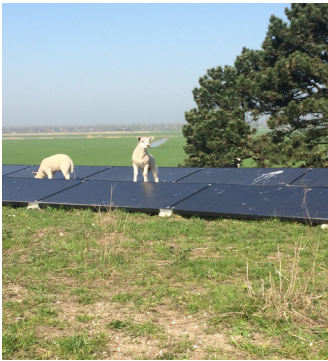
Lammetjes tussen de zonnepanelen