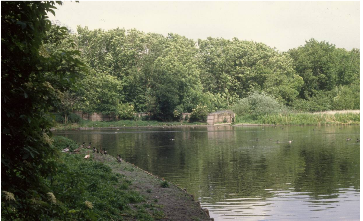
Kooiplas eendenkooi De Hoop