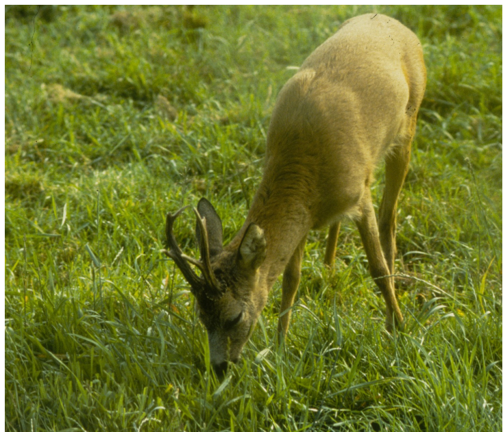
In de nieuwe Flora en faunawet behoort het ree niet meer tot de zgn. wildsoorten

Opm.: een wetswijziging is in de maak, waardoor er onder voorwaarden toch op wildsoorten gejaagd kan worden. Hiervoor is echter ten allen tijde toestemming van de eigenaar nodig via een jachthuurovereenkomst.