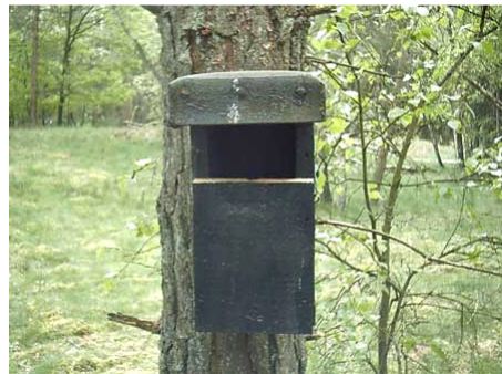
Nestkasten mogen bij LNH, maar met mate en niet overal