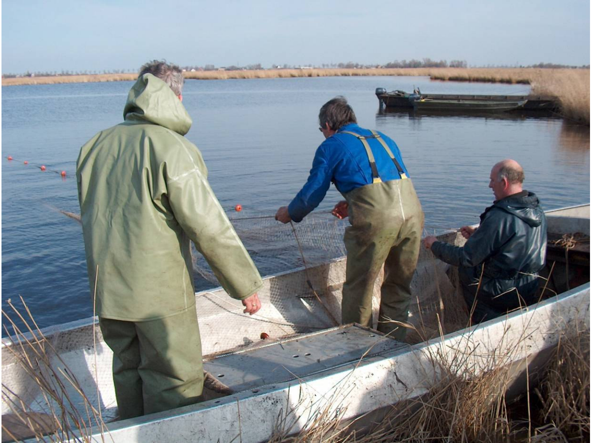
Met een op de natuur gericht visstandbeheerplan is vissen in terreinen van Landschap Noord-Holland mogelijk