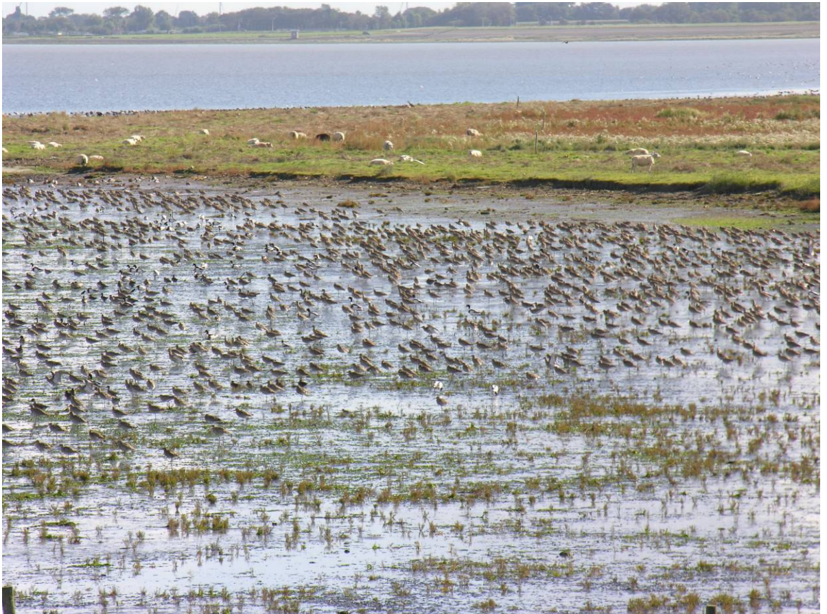
Balgzand: internationaal belangrijk Habitat- en Vogelrichtlijngebied