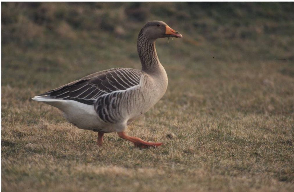
Grauwe ganzen kunnen door hun massale begrazing schade toebrengen aan natuurdoelen. In sommige gevallen kan dan sprake zijn van soortbeperkende maatregelen.

De soortbeperkende maatregelen worden in het algemeen uitgewerkt in Faunabeheerplannen, die de goedkeuring van het college van GS vereisen en waaraan LNH meewerkt.