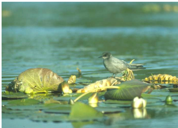
Zwarte stern heeft baat bij soortbevorderende maatregelen

Meer gedetailleerde uitgangspunten en voorbeelden van soortgerichte maatregelen worden genoemd in hoofdstuk drie.