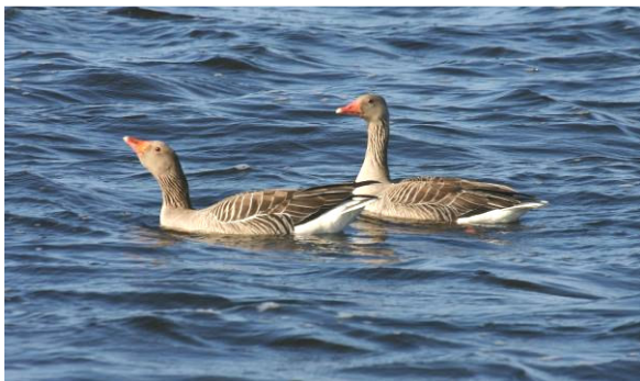
Grauwe gans

Minder riet- of grasopbrengst door ganzenvraat heeft gevolgen voor het inkomen van de gebruiker en kan leiden tot schadeclaims. De schade aan de landbouw ontstaat tussen maart en eind juni, het grootste deel houdt verband met het vliegvlug worden van de jongen en vindt in juni plaats. De hoogte en het aantal van de schadeclaims nemen momenteel toe.