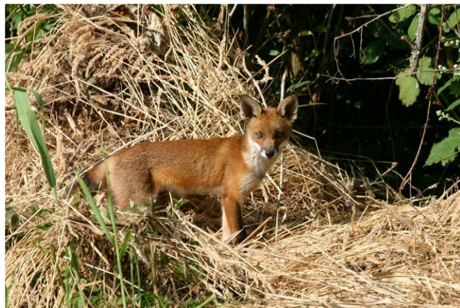
Vos in moerasbosje

De beleidskaders hiervoor worden in dit hoofdstuk nader omschreven. Daar waar het gaat om het specifieke soortbeperkend beleid ten aanzien van een bepaalde diersoort, zoals vos, grauwe gans, ree of damhert, wordt verwezen naar hoofdstuk 7.