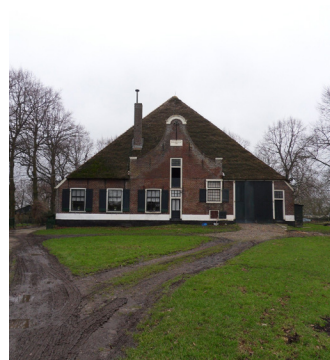
Voorgevel van de stolpboerderij