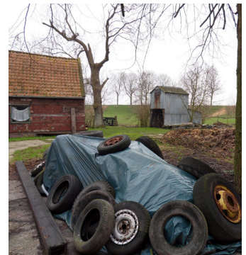
Resten van de bedrijfsvoering