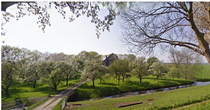
Overzichtsfoto vanaf de dijk